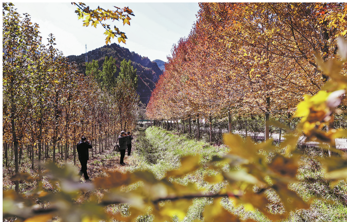
10月11日，洛南县洛源镇张坪村美枫农业科技园秋色初染。美枫农业科技2017年自美国引进100多种景观苗木，经过数年的精心培育，实现规模化生产，不仅实现产业增收，也成为游客打卡地。