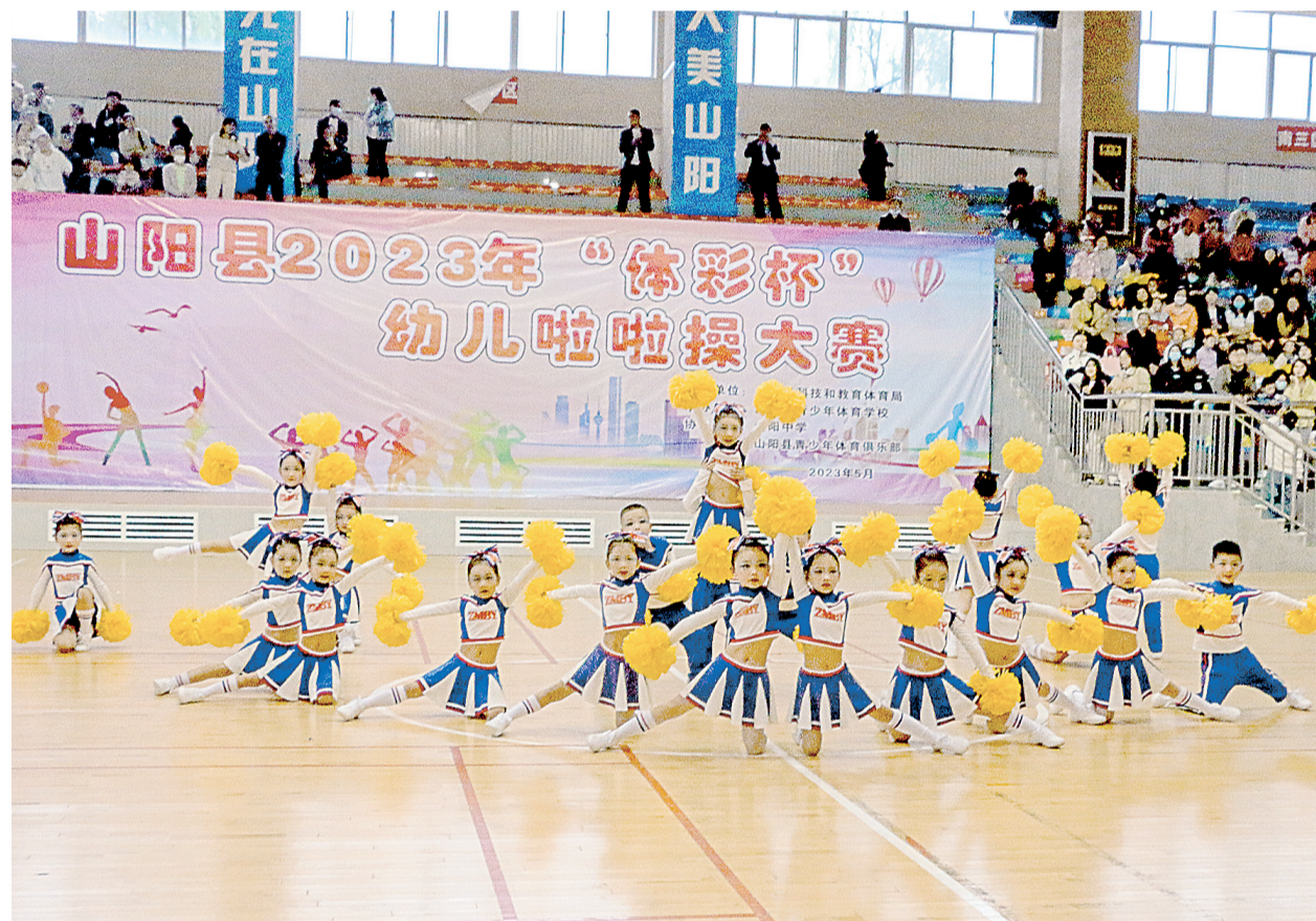
5月8日至10日，山阳县2023年“体彩杯”幼儿啦啦操大赛在山阳县体育馆举行，来自全县22个幼儿园的600多名幼儿在精彩的表演展示童趣和风采。图为山阳县第二幼儿园的孩子们在赛场上表演。

该县创新评价方式，完善评价体系，开展专项督学，及时梳理督学中发现的保教问题，提高日常教学管理的实效性，推动保教质量提升。创新