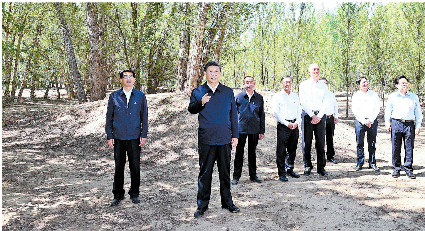
6月5日至6日，中共中央总书记、国家主席、中央军委主席习近平在内蒙古巴彦淖尔考察，并主持召开加强荒漠化综合防治和推进“三北”等重点生态工程建设座谈会。这是6日上午，习近平在临河区国营新华林场考察。

新华社内蒙古巴彦淖尔6月6日电 中共中央总书记、国家主席、中央军委主席习近平近日在内蒙古自治区巴彦淖尔市考察，主持召开加强荒漠化综合防治和推进“三北”等重点生态工程建设座谈会并发表重要讲话。他强调，加强荒漠化综合防治，深入推进“三北”等重点生态工程建设，事关我国生态安全、事关强国建设、事关中华民族永续发展，是一项功在当代、利在千秋的崇高事业。要勇担使命、