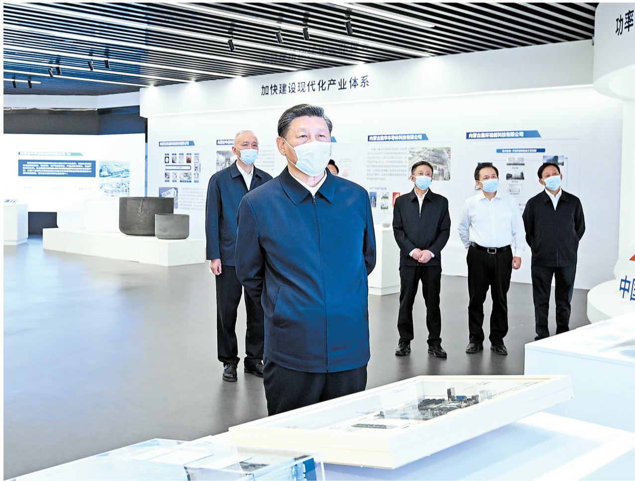
6月7日至8日，中共中央总书记、国家主席、中央军委主席习近平在内蒙古考察。这是7日下午，习近平在呼和浩特中环产业园考察。

新华社呼和浩特6月8日电 中共中央总书记、国家主席、中央军委主席习近平近日在内蒙古考察时强调，要牢牢把握党中央对内蒙古的战略定位，完整、准确、全面贯彻新发展理念，紧紧围绕推进高质量发展这个首要任务，以铸牢中华民族共同体意识为主线，坚持发展和安全并重，坚持以生态优先、绿色发展为导向，积极融入和服务构建新发展格局，在建设“两个屏障”、“两个基地”、“一个桥头堡”上展现新作为，奋力书写中国式现代化内蒙古新篇章。