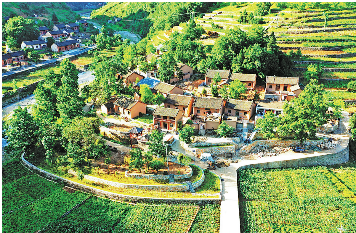
近年来，丹凤县竹林关镇以乡村振兴为抓手，以秦岭山水乡村建设为契机，进行人居环境整治，加快农房和厕所改造进度，建设高标准农田水利设施，打造乡村振兴示范点，让村庄环境更美、颜值更高。

下一步，市“双50”战略农村板块推进工作专班办公室(市乡村振兴局)将主动对接联络参与我市驻村帮扶的93家省级党政机关、企事业单位以及西安市、咸阳市、杨凌示范区等9个省内区域对口帮扶单位，帮销商洛土特产，加速推动商洛土特产进入西安大市场，切实解决销售难题，持续增加群众收入。