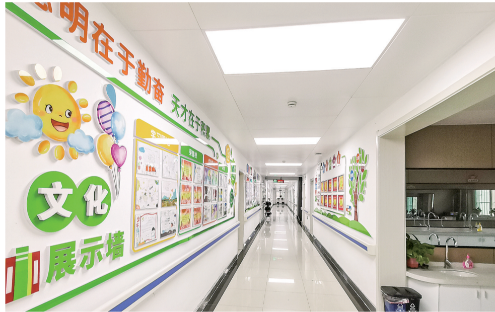
充满童趣的文化墙

记者手记:在市儿童福利院,看着一张张稚嫩而可爱的脸庞,从不能走路到能独立行走,从不能说话到会叫“妈妈”,一次鼓掌,一个微笑,无不饱含着全体工作人员和全社会对孩子们的鼓励 and 关爱。这个大家庭集中了世界上的一些苦难,也凝聚了人世间最温暖的情感。市儿童福利院工作人员追求的目标是让孤弃儿童有尊严、阳光地生活,而孩子们残缺的人生也因为这些工作人员的存在变得圆满美妙。人生本该被爱包裹,福利院的工作人员将个人的爱无限放大,包裹了那么多孩子,我想坚定地对他们说:“孩子们,不要怕,有这么多人爱你们、关心你们、照顾你们的叔叔阿姨,有党和政府的好政策,你们的未来一定会越来越好。在你们的背后,有一个对你们永不放弃的强大国家。”