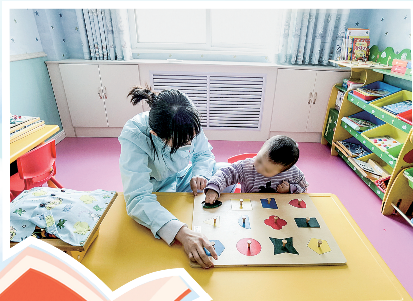
“妈妈”在辅导孩子阅读

“妈妈”们的年龄从70后到90后不等,她们的职业有护理师、康复师、特教师、营养师……身份特殊,工作繁琐。