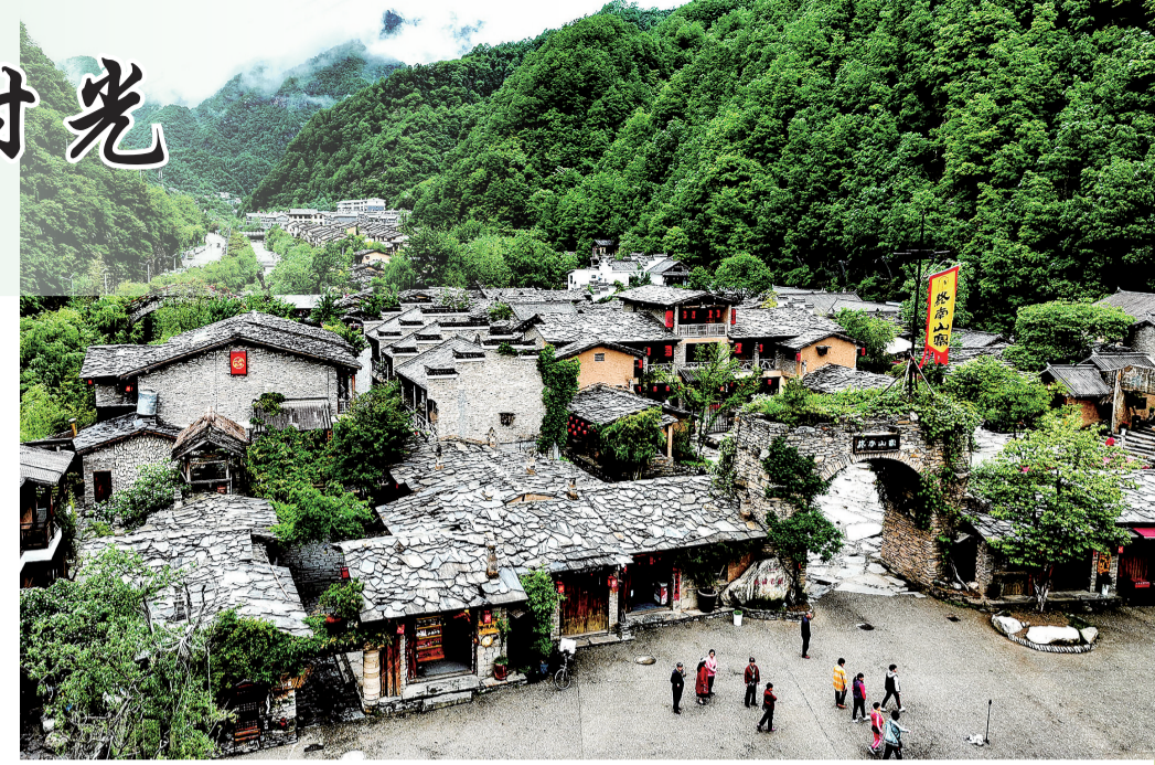
春日终南山寨一角。

回来吃一顿地道的柞水菜,腊肉炒蒜薹、凉拌神仙豆腐、酸菜魔芋;下午就在院子里打打牌,或者干脆什么都不做,就那么坐着,看山,看云,看屋旁那棵桃树又开了几朵花。