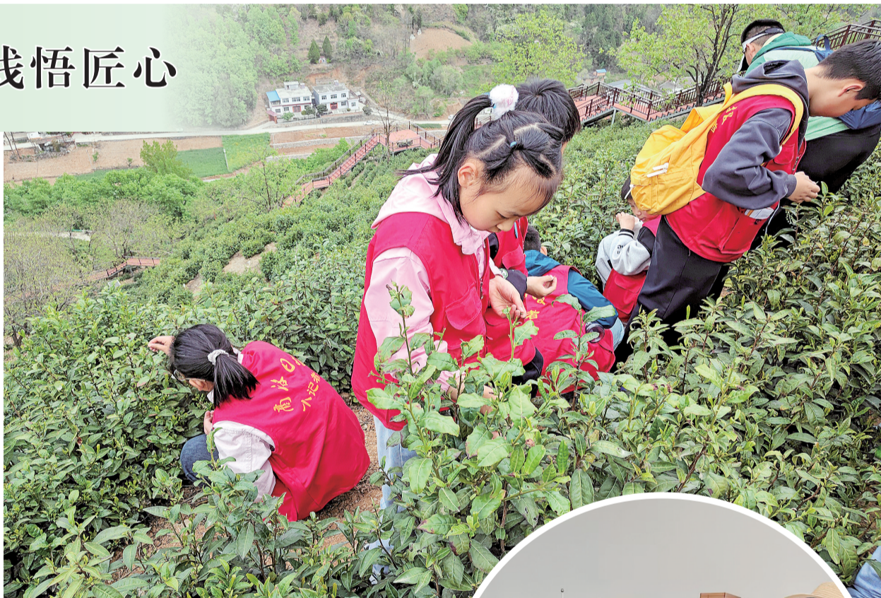
△茶山上采摘新鲜茶叶。

参观结束后，检察官与同学们进行交流互动，耐心解答同学们提出的法律疑问，围绕青少年关心的热点问题展开交流讨论，引导大家明辨是非、敬畏法律、学会用法律武器保护自身合法权益。现场氛围轻松热烈，同学们积极参与、踊跃发言，在轻松互动中加深了对法律知识的理解和记忆。