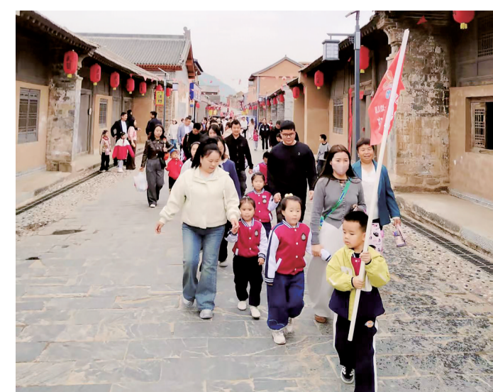
4月11日，丹凤县金山第一幼儿园在武关镇开展亲子活动，师生及家长一起访古城、赏花海，举办花田走秀、写生等活动，共同体验春天的美好。

柞水县纪委监委坚持严肃执纪执法与督促整改并重，抽调人员组成联合检查组，对全县耕地和基本农田保护工作进行专项督导，督促各镇（街道）、相关单位认真开展专项整治。同时，注重加强与农业农村等职能部门的沟通协作，通过数据共享、卫星图斑比对、田间走访、问题线索移送等工作机制，形成耕地保护监督工作合力，重点排查耕地“非农化”“非农化”、耕地撂荒等问题，深挖彻查耕地乱象背后的责任、腐败和作风问题，以“长牙齿”的硬措施执纪问责，坚决为守住耕地保护红线和粮食安全底线提供有力保障。