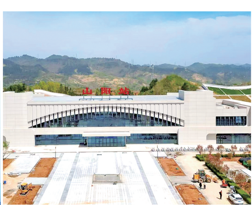
山阳站的配套设施建设正在加速推进。