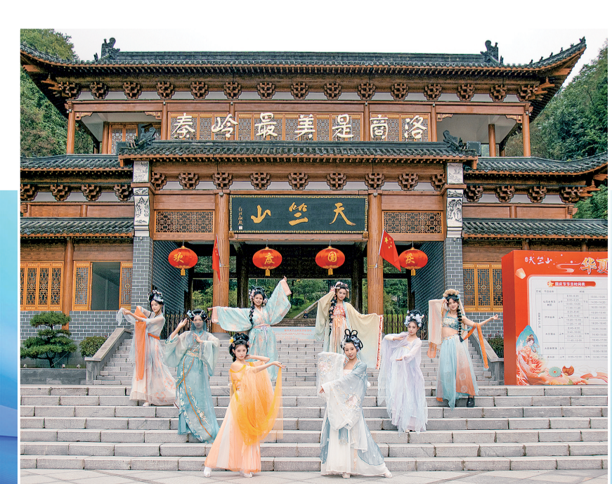
为提升游客体验感，天竺山景区推出汉服秀等系列活动。