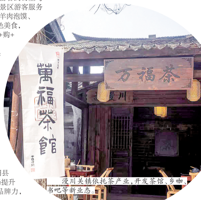
漫川关镇依托茶产业，开发茶馆、书吧等新业态。