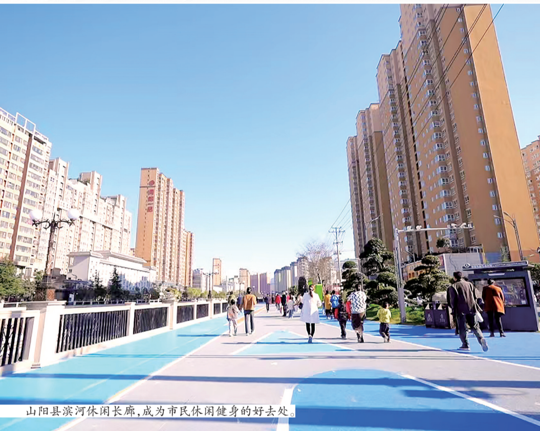
山阳县滨河休闲长廊，成为市民休闲健身的好去处。

3月29日，西十高铁陕西段正式启动联调联试，随着列车在平滑的轨道上疾驰，这条贯通陕鄂两省的高铁大通道，全面进入开通运营前的关键冲刺阶段。 西十高铁是陕西“米”字形高铁网中重要一“捺”，途经陕西省西安市、商洛市和湖北省十堰市，接入已建成的十堰至武汉高铁。西十高铁在山阳县境内有山阳站和漫川关两座高铁站，一个县同时设两个站在全国为数不多，这也为山阳带来了更多的发展机遇。 高铁时代的到来，对山阳而言，意味着什么？2009年10月，山阳第一条高速公路——商漫高速全线开通，使山阳到西安及武汉周边的时间缩短到3小时以内，改变了过去路程远、弯道多的出行困境。 新地标开启新征程。西十高铁开通后，山阳将实现半小时到西安，两小时到武汉。曾经难以逾越的天堑，在车轮的滚动中一次次被改写。 高铁开通，带来的不仅是交通的便利，更是经济社会的全面腾飞。为全面迎接高铁时代的到来，山阳县多次召开专题会议，出台《迎接高铁时代工作方案》，组建工作专班，紧扣建设“一城两区三地”目标，全力抓好综合协调推进、配套设施建设、交通运营保障、媒体宣传推广、环境综合整治、特色产业培育、要素服务保障、安全稳定管理8个方面工作，并分为近期、中期、远期3个任务阶段，确保西十高铁按期通车。