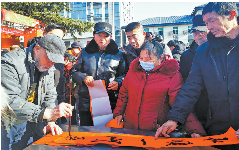
一月二十五日,由市委文明办、市文联、市慈善协会、商洛职业技术学院、商州区纪委监委主办的“我们的中国梦·文化进万家”迎春送福写春联活动,在商州举行。活动现场,书法家们挥毫泼墨,为市民们书写春联,传递新春祝福。

建议会议议程是:听取和审议政协商洛市第五届委员会常务委员会工作报告;听取和审议政协商洛市第五届委员会常务委员会关于五届二次会议以来提案工作情况的报告;列席商洛市第五届人民代表大会第四次会议,听取和讨论商洛市人民政府工作报告和其他报告;委员大会发言;审议通过政协商洛市第五届委员会关于五届三次会议提案审查情况的报告;审议通过政协商洛市第五届委员会第三次会议政治决议和其他决议;通报表彰2023年度优秀市政协委员,五届二次会议以来优秀提案、提案工作先进单位和先进个人;领导讲话。(市政协办公室)