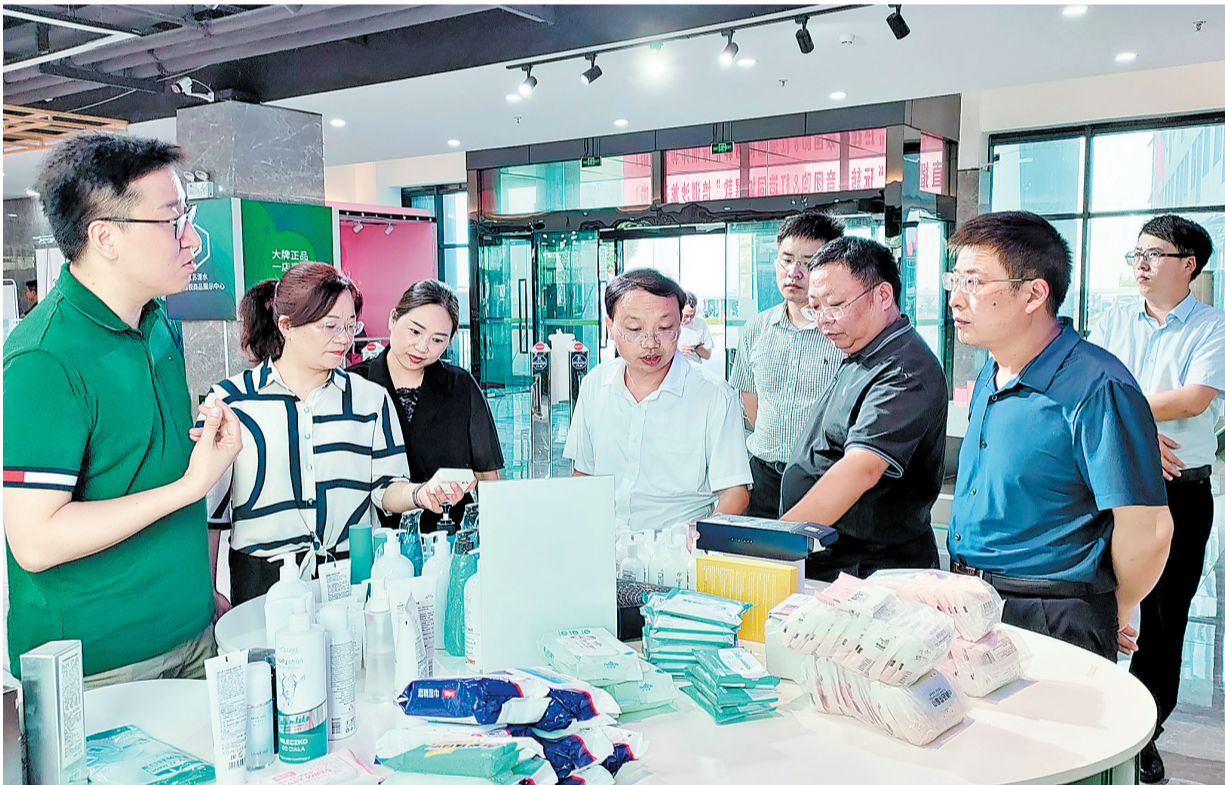
8月15日至16日，商南工业集中区管委会组织部分干部和企业负责人赴南京市开展叩门招商活动，推介商南产业发展现状、营商环境保障等方面的优势，并诚邀企业家朋友们来商南旅游考察、寻找投资发展商机。