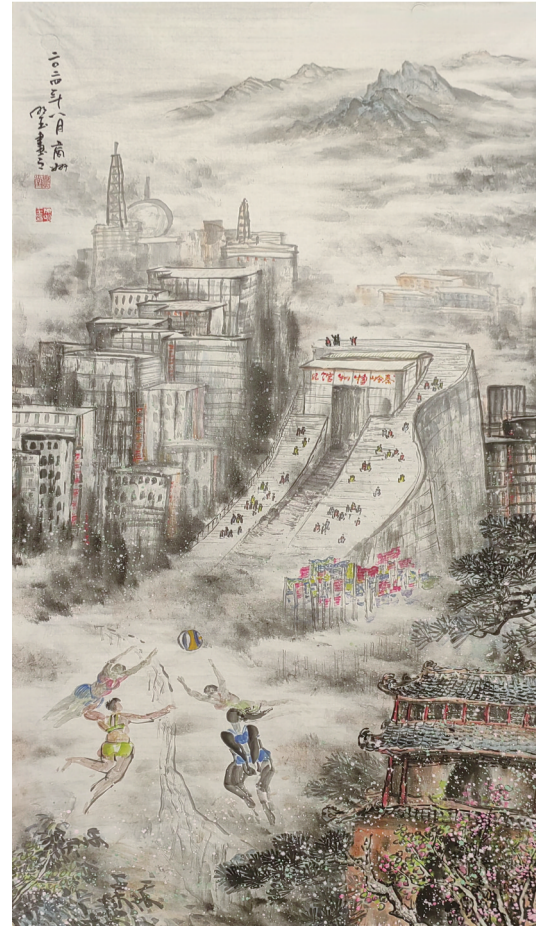
国画 陈明玉 作

轻柔的海风徐徐拂过，海鸥在广 袤无垠的海面上振翅翱翔。它们忽 高忽低地，盘旋在人们的头顶，如同 自然的使者，欢迎着远道而来的朋 友。若有人慷慨投食，它们便会迅速 俯冲，精确无误地叼走食物，宛如空 中的杂技演员；但它们又对食物不屑 一顾，高傲地转身飞走，似乎在宣示 自身的自