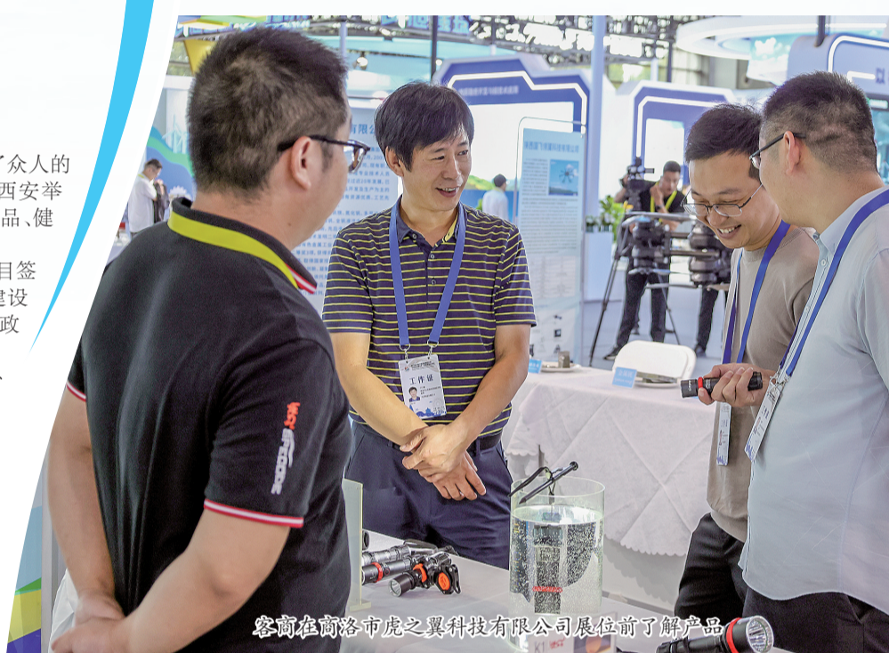
客商在商洛市虎之翼科技有限公司展位前了解产品