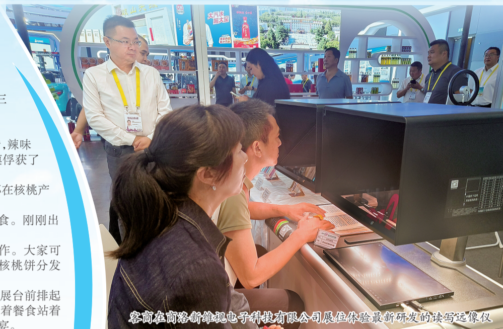
客商在商洛新维视电子科技有限公司展位体验最新研发的读写远像仪