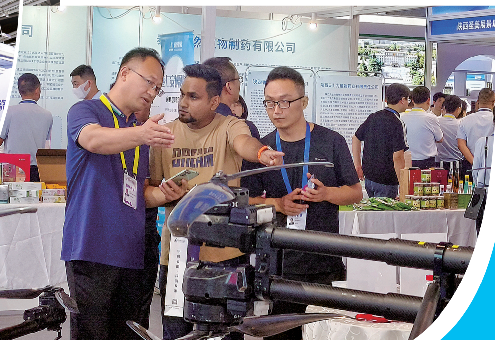
陕西国飞领翼科技有限公司工作人员热情地向围观客商介绍无人机的应用场景