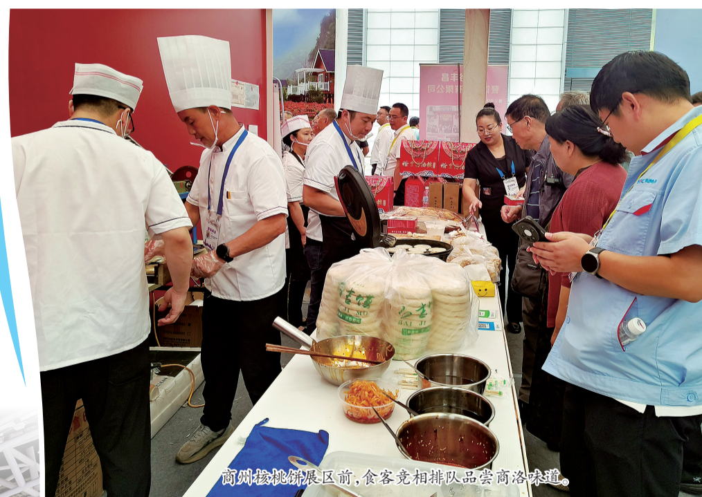
商州擀面皮展区前，食客竞相排队品尝商洛味道。