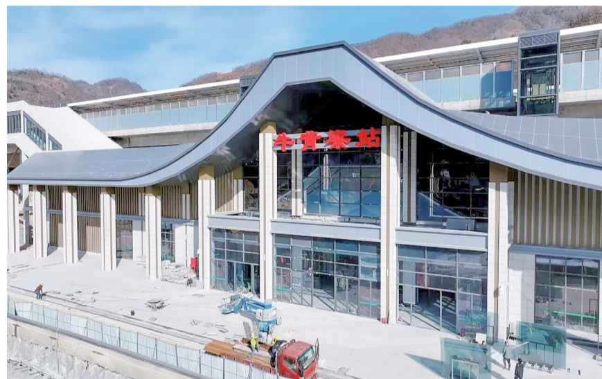
西康高铁柞水县牛背梁站

站在“十五五”开局的新起点,柞水县干部群众心往一处想、劲往一处使,一马当先、奋勇前进。在全县上下的共同努力下,必将推动高质量发展取得新成效,奋力谱写中国式现代化柞水新篇章。