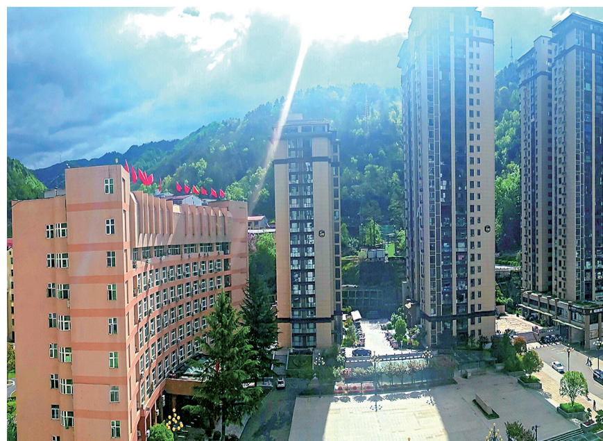
美丽的柞水县幸福里小区