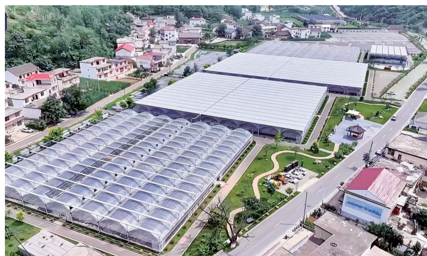
小岭镇金米产业园区