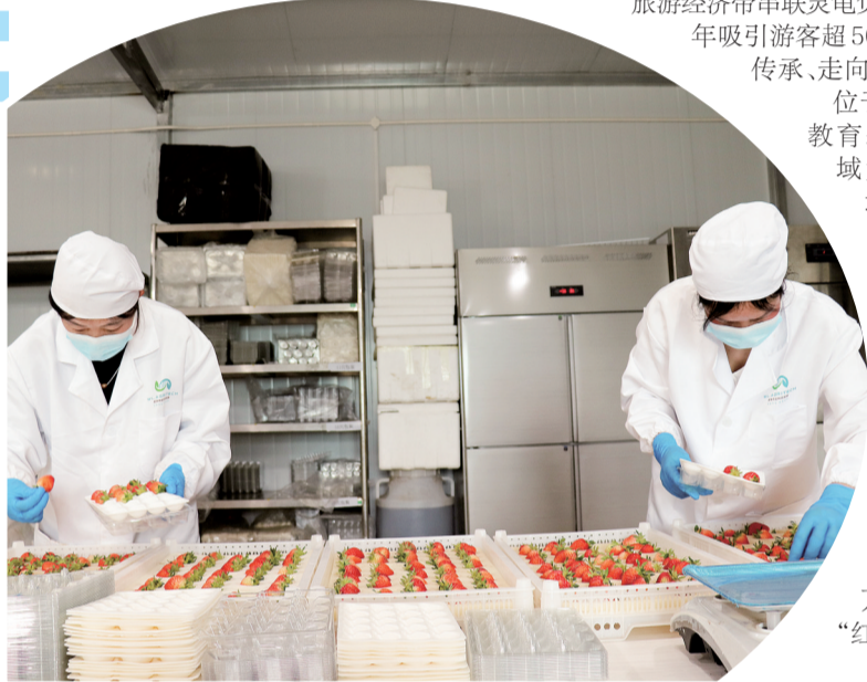
洛南县蔚澍农光农业科技有限公司里工人正在挑选草莓。

春风拂过秦岭,携着洛河清波与汉字故里的墨韵,轻轻唤醒了藏在秦岭深处的洛南县保安镇。在远山如黛、近水含烟的诗意画卷里,洛惠渠犹如一条绸带在山腰上蜿蜒舒展。山脚下,洛水潺潺穿镇而过,唤醒了仓圣社区。草