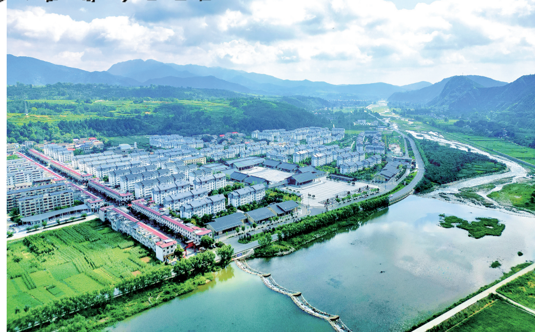
春日里的保安镇,青山含黛,绿水含春。

镇聚果、菌、畜四大主导产业,建园区、育龙头、联农户,让特色产业遍地开花,撑起群众增收致富的“钱袋子”。