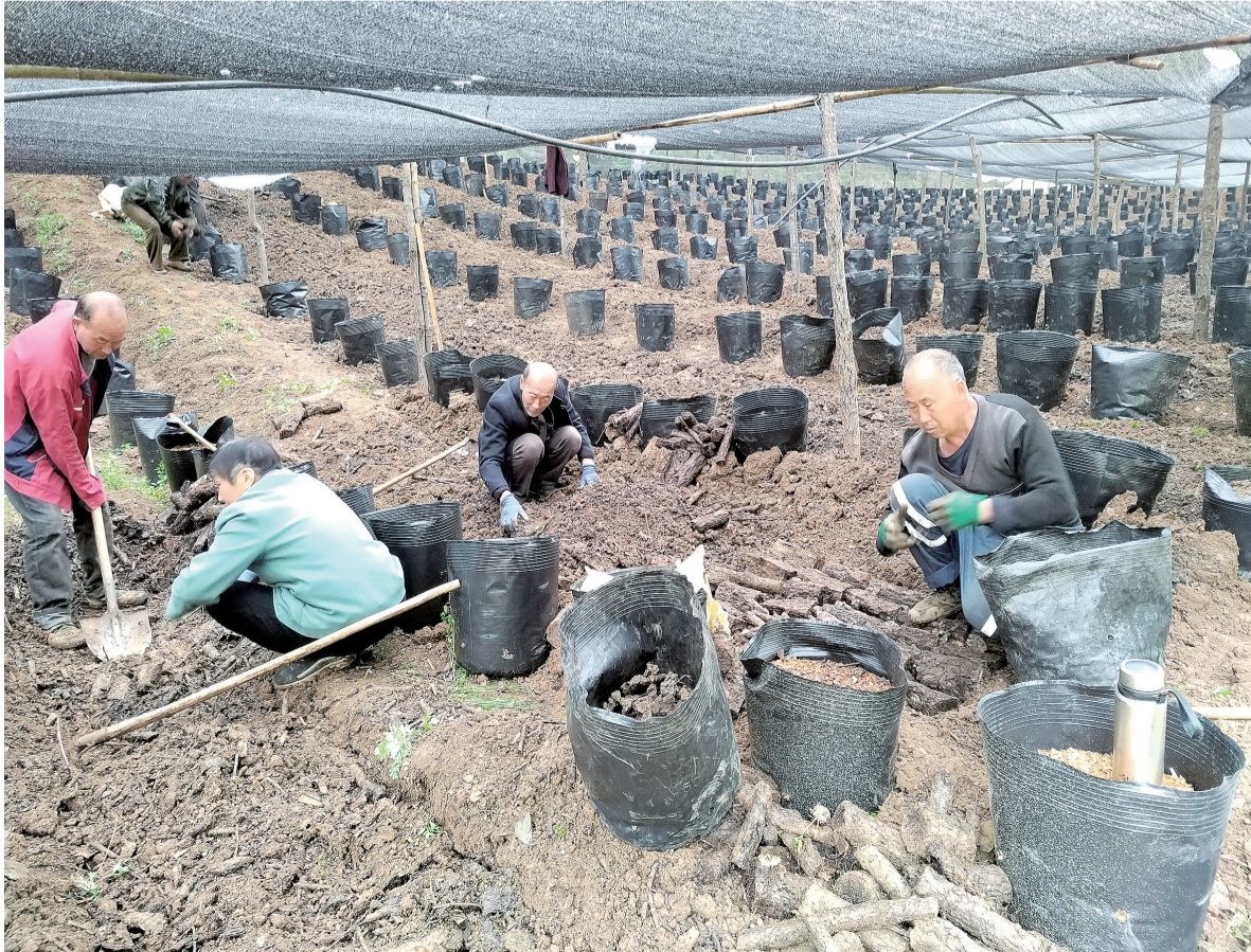
4月25日,镇安县米粮镇东胜村村民正在中药材种植基地种植猪苓。东胜村立足当地生态资源与气候优势,大力发展猪苓中药材种植产业,通过建基地、拓规模,带农户,把特色中药材培育成群众增收致富的支柱产业。

此外,县纪委监委对群众反映的、舆论媒体关注的、监督检查中发现的“四风”问题线索,重要舆情,第一时间组织核查;强化“严”的措施,对不知止、不收手、不收敛的顶风违纪行为严查快处、严肃追责,坚决以“零容忍”的态度,发现一起查处一起,决不姑息;营造“严”的氛围,对典型问题点名道姓通报曝光,释放“遵规比平时要求更严、违纪比平时处理更重”的强烈信号,形成利剑高悬、震慑常在的高压态势。目前,共查处违反中央八项规定精神案件10件11人,其中,违规吃喝问题3件3人。