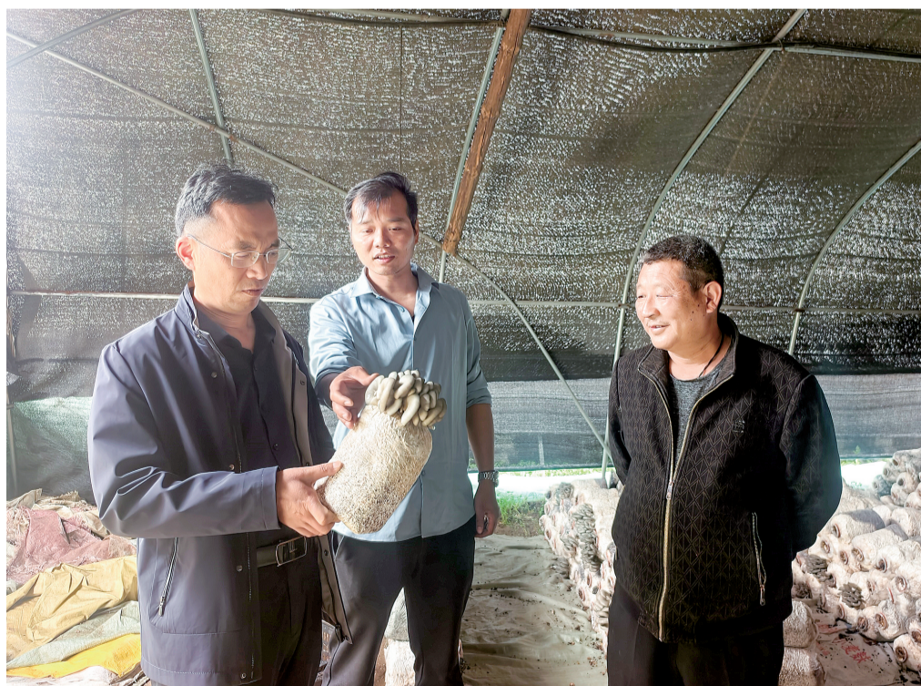
4月28日,市农技站专家深入洛南县洛源镇,精准对接农业产业发展需求,开展技术服务,为当地农业生产注入科技动能。(本报通讯员 雷鸣 摄)

畅通维权渠道,强化法治宣传引导。持续加大劳动保障法律法规宣传力度,聚焦劳动合同、考勤管理、工资发放等重点内容,深入工地一线,通过实地宣讲、设立公告牌、发放宣传手册等方式,常态化开展普法宣传,引导企业合规用工、劳动者依法维权。优化便民维权服务,开通维权线上投诉二维码,搭建“线上+线下”多元诉求受理渠道,大幅提升欠薪诉求受理响应便捷度。创新联动机制,提升案件处置质效。依托劳动保障一站式调解办公模式,整合监察执法、仲裁调解工作力量,打破固有工作壁垒,实行统一轮流办案,统筹协调处置工作,大幅压缩欠薪案件办理时限。强化劳动保障与司法行政行政执法衔接,从严从重打击恶意欠薪违法行为,营造欠薪“一处违法、处处受限”的共治氛围,持续巩固全县根治欠薪良好工作态势。