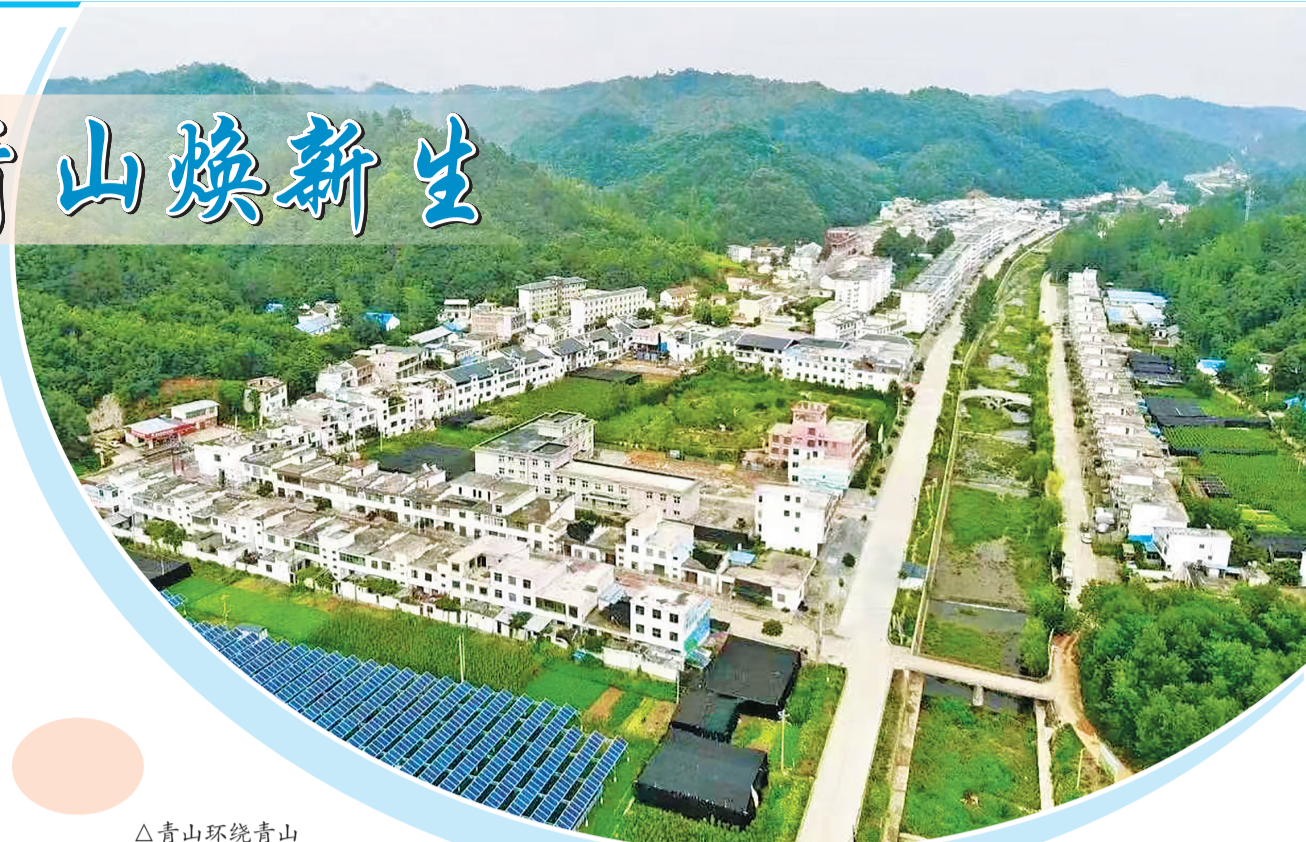
△青山环绕青山镇(航拍)

住这份文脉,就是守住了青山的根与魂,并让其在新时代焕发新的光彩,增强文化自信,涵养精神气质,凝聚发展力量。”