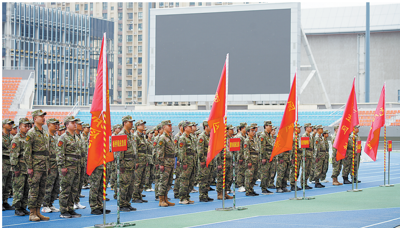
5月13日,商州区人武部在市体育场开展2026年度民兵集合点验大会。商州区基干民兵庄严宣誓、接受点验,充分展现了新时代民兵良好的军事素质与昂扬的精神风貌。

当天还开展了快递行业劳动规则和算法集体协商,企业与职工方围绕女职工权益保护、职工健康体检、户外休息驿站、通勤充电保障、社会保险参保、常态化协商机制建设等一线职工关心的问题,进行充分沟通协商达成共识,签署了集体协商草案。