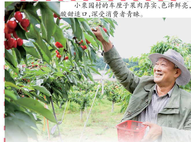
小栗园村的车厘子果肉厚实、色泽鲜亮,酸甜适口,深受消费者青睐。

如今的龙驹寨街道,特色产业遍地开花,集体经济持续壮大,群众收入稳步提升,中药材种植突破1万亩,规模养殖总量保持在300万只(头)以上,袋料香菇、冬枣、葡萄等特色种植规模不断扩大,一暖产业兴旺、生态宜居、生活富裕的乡村振兴壮美画卷正徐徐展开。