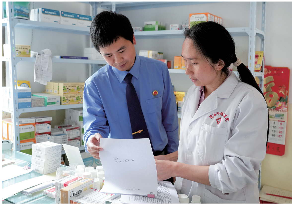
5月28日,商南县人民检察院组织开展药品安全专项检查。检察干警深入辖区诊所、药店核查是否存在违规开具处方药、超范围经营、医保结算异常等问题。针对发现的个别药店处方留存不全、个别诊所药品储存条件不符合规定等情况,当场提出整改意见,并督促相关单位限期落实,确保群众用药安全可追溯、可监管。

本报讯(通讯员 赵建民)入汛以来,镇安县永乐街道聚焦汛期地质灾害风险防控重点环节,通过及时巡查、部门联动、避险转移和值班值守等措施,全力守护辖区群众生命财产安全。 永乐街道严格落实“雨前排查、雨中巡查、雨后核查”制度,及时组织对重点区域、重点部位开展再巡查、再排查。截至目前,已累计巡查排查地灾隐患点51处、风险区域86个,全面实行“零报告”制度,牢牢守住风险防控第一道关口。构建多部门联动应急机制,联合公安、卫健、民政等部门协同作战;通过“演练+宣传”双管齐下,组织受威胁群众参与避险实训,累计参与群众7000多人次,发放宣传资料9000余份,进一步规范撤离避险流程,全面提升群众自救互救能力。密切关注天气预警和雨情变化,针对隐患突出、风险不明的重点区域,永乐自然资源所及时向街道及属地村委会报告,督促村组干部加强入户提醒,现场查看和动态跟踪;对受威胁群众提前做好转移避险准备,坚决做到能转快转、应转尽转,不落一户、不漏一人,从源头规避安全风险。严格执行街道、村(社区)两级24小时领导带班、值班制度,压实防灾责任人、监测员岗位责任;确保汛期险情信息上传下达畅通无阻,各项防灾指令第一时间落地执行,守牢安全底线。