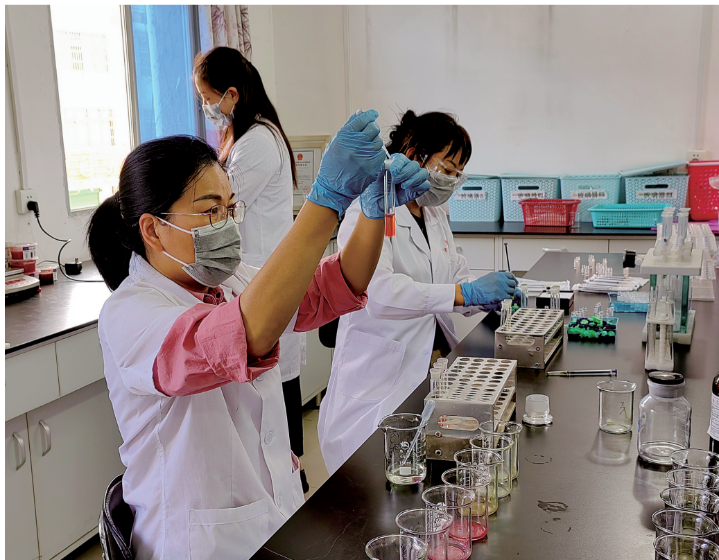
六月二日,山阳县农产品质量安全检测站检测员对照国标进行果蔬农药残留定量检测。眼下,正值本地果蔬集中上市时段,山阳县农产品质量安全检测站检测员连续多日加班加点,开展农产品农药残留定量检测工作,守护舌尖上的安全。(本报记者 肖云 摄)

十年寒窗苦读,今朝静待花开。商洛供电公司将持续绷紧保电安全弦,从严从细落实各项保电举措,以可靠的电力保障、优质的供电服务、务实的责任担当,全程护航2026年高考顺利进行,助力全市莘莘学子圆梦考场、不负韶华。