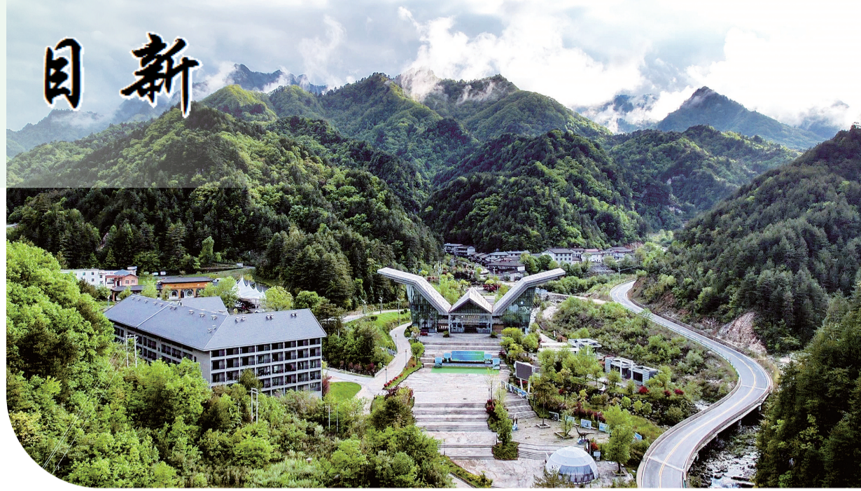
群山环抱中的木王国家森林公园门户区林木葱茏、绿意盎然。

木王镇简介: 木王镇地处镇安县西南边陲,南与安康市汉滨区接壤,西与宁陕县毗邻,镇域面积440平方公里,G345国道穿境而过。作为国家4A级景区木王国家森林公园所在地,全镇森林覆盖率达88.6%,生态优越、气候宜人,是陕西省首批“特色气候小镇”。近年来,木王镇立足生态优势,因地制宜壮大冷水鱼、中药材及民宿康养等特色产