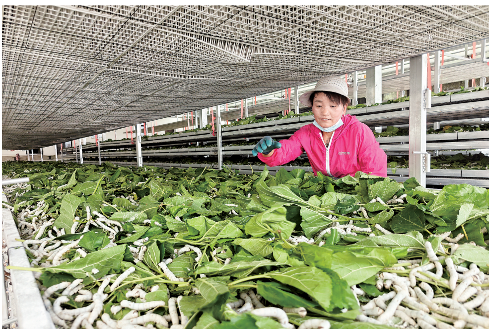
近日,在镇安县达仁镇枫坪村的智能养蚕工厂内,务工群众正在给桑蚕投喂新鲜桑叶。近年来,枫坪村推动传统蚕桑业、向规模化、标准化转型升级,有效带动五十多名群众就近务工、稳定增收。

据了解,2017年12月,为落实消费帮扶工作部署,在洛南县委、县政府统筹部署下,洛南县供销社依托南京市江宁区农业电商产业园资源,注册成立陕西洛南电子商务有限公司。“公司的洛南县苏陕协作农产品供销基地,让更多人了解到洛南的多种农产品,这里也成为搭建宁洛两地农产品产销对接的重要平台。”陕西洛南电子商务有限公司总经理王礼林介绍,自公司成立以来,消费帮扶成效持续凸显,不仅逐年丰富产品品类,还扩增合作主体,打通了洛南农特产品销往南京的销售通道。截至目前,公司已与全县21家农民专业合作社、农业企业建立长期稳定的供货合作关系,涵盖豆腐干、核桃制品、核桃油、亚麻籽油、菜籽油、金银花茶、羊肚菌、土蜂蜜等150多个优质农特产品,累计销售额8000多万元,全方位拓宽了本地农产品销售渠道。