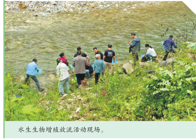
水生生物增殖放流活动现场。

近年来,镇安县始终坚持生态优先、绿色发展理念,持续加大水生态保护力度,常态化开展增殖放流、河道巡查管护和生态普法宣传,严厉打击非法捕捞行为,全方位守护流域水生态环境。“镇安县将持续巩固禁渔成果,健全常态化生态修复管护机制,不断提升水生态治理水平,持续绘就水清鱼跃、岸绿景美的生态新画卷,全力守护‘一泓清水永续北上’。”市生态环境局镇安分局相关负责人表示。